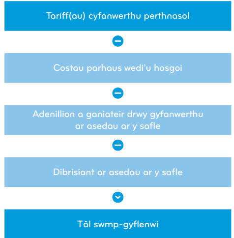
Ffigur 1: Dull tynnu cyfanwerthu Ofwat

1 Mae taliadau am swmp-gyflenwi wedi'u pennu i gydymffurfio â chanllawiau presennol gan gynnwys ystyried rhestr CEPA o gostau a gaiff eu hosgoi. Hefyd, mae'r Cwmni wedi cyfrannu at weithgor Ofwat sy'n arwain y diwydiant ar daliadau am swmp-gyflenwi ar gyfer NAVs ers iddo gael ei sefydlu yn 2021. Mae'r allbynnau o'r grŵp hwn hefyd wedi cael eu hystyried wrth bennu taliadau 2025/26. Caiff y costau parhaus a gaiff eu hosgoi o'r fethodoleg codi tâl ei hun eu hadolygu'n rheolaidd pan gaiff canllawiau diwydiant newydd eu cyhoeddi gan Ofwat neu pan gaiff astudiaethau achos o'r diwydiant eu cyhoeddi.